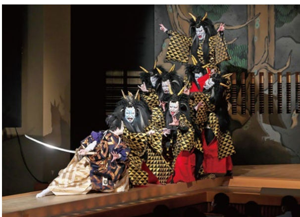
「日本振袖始」(今年の舞台より)

◎印は、「社会人のための歌舞伎鑑賞教室」です。◎印は、主に外国人のお客様を対象とする「Discover KABUKI」です。