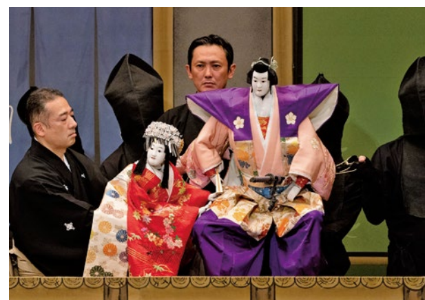
『絵本太功記』(昨年の舞台より)

◎印は、「社会人のための文楽鑑賞教室」です。①印は、主に外国人のお客様を対象とする「Discover BUNRAKU」です。