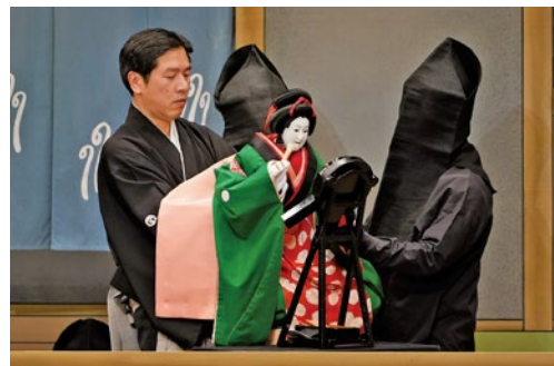
文楽鑑賞教室「新版歌祭文」