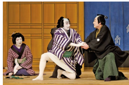
歌舞伎鑑賞教室「双蝶々曲輪日記—引窓—」