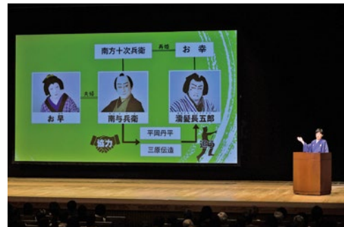
解説「歌舞伎のみかた」