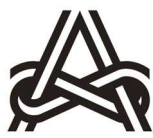
芸術文化振興基金助成事業