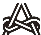
芸術文化振興基金