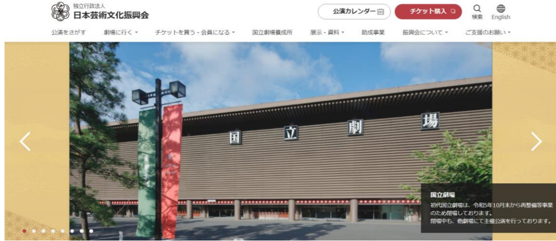
日本芸術文化振興会ホームページ

※令和8年度国立劇場・国立演芸場主催の公演は、他劇場にて実施いたします。 公演の詳細は、下記の独立行政法人日本芸術文化振興会ホームページでご確認ください。