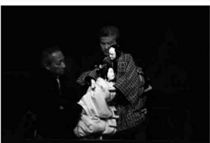
【曾根崎心中】天神森の段