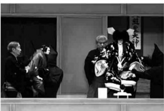
【菅原伝授手習鑑】寺子屋の段

五段目「大内天変」 都が不穏な情勢となり祈禱が執り行われる宮中で、次々に怪異な現象が発生します。それは権勢におごる時平にも襲い掛かり、事態は風雲急を告げるのです。大団円のこの場面も昭和四十七年以後の上演で、斎世親王と菅原家の復権を描きます。