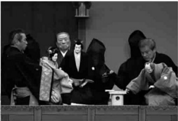
【菅原伝授手習鑑】桜丸切腹の段