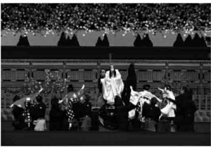
【菅原伝授手習鑑】車曳の段

【茶筌酒／喧嘩／訴訟／桜丸切腹】 三兄弟の父で菅丞相に長年仕えて来た四郎九郎は齡七十を祝し丞相から白太夫の名を拝領します。その誕生日に賀の祝いが行われ、三兄弟の女房たちが集まります。その祝いの場にも政変が影を落とし、ついには悲劇的な結末を迎えるのです。齡を重ねた白太夫の姿そのままに滋味あふれる「佐太村」。悲劇的な最期を遂げる桜丸と見送る人々の嘆きが涙を誘います。 四段目「天拝山」 筑紫に流された菅丞相のもとに白太夫と梅王丸がそれぞれ無聊を慰めるため訪れます。梅王丸が取り押さえたのは丞相殺害を目論んでいた時平の家来。その白状を聞いた菅丞相の形相は一変するのです。白太夫による飄逸な牛の講釈のち、菅丞相が憤怒により雷神の姿に変ずるといふ展開で、御霊信仰の対象である道真のイメージを投影された姿が描かれます。