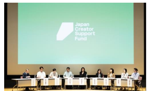
令和7年6月5日開催 中間報告会の様子