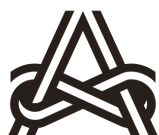
芸術文化振興基金