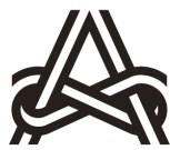
芸術文化振興基金助成事業