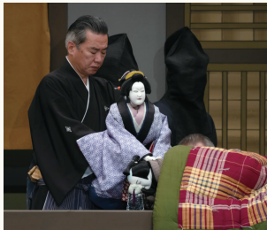
第一部『心中天網島』

中年の商人と遊女との心中事件を題材に、死地へと追いやられる恋人二人の道程を辿りながら、その周囲の人びとの苦悩が克明に描かれます。互いに心中をする約束をした大坂天満の紙屋治兵衛と遊女・紀伊国屋小春。この二人を心配する周囲の人々の善意が、二人の運命を思わぬ方向へ導いてゆきます。織り成される人情の機微、緊密なる劇展開が繰り広げられます。