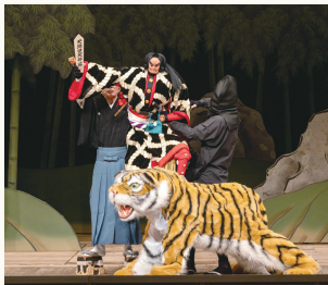
第二部『国性爺合戦』

日本人と中国人の血を受け継ぎ、日本から中国大陸、台湾へと渡り、明国再興に尽力した鄭成功(国性爺)の活躍を題材とし、国境を越えて大胆に創作された時代物です。肥前平戸(長崎県)の漁師・和藤内は中国人の父・老一官と日本人の母とともに、父がかつて仕えていた明の再興のため、大陸へ渡ります。三人は中国きっての名将・五常軍甘輝を味方につけるために、その居城へと向かいます。