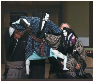
第三部『女殺油地獄』

複雑な家庭環境で育った主人公が無頼な行動を重ねた揚げ句、強盗殺人にまで至る過程を描く異色作です。油商河内屋の放蕩息子である与兵衛を取り巻く周囲の人々の思いやりにも関わらず、ついに顔なじみのお吉を殺害する凄惨な結末へと繋がっていく展開に、初夏の市井の風俗とともに登場人物たちが背負った深い業が映し出されます。